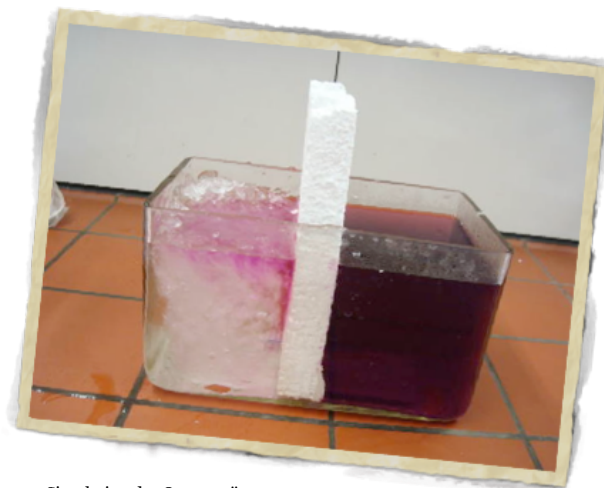
Simulation der Ozeanströmungen