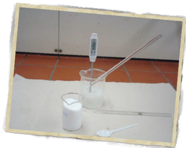
Experiment zur Gefrierpunktniedrigung