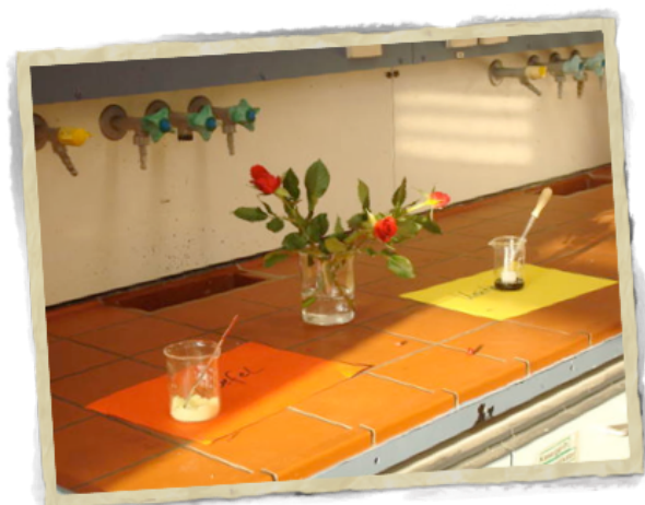
Experiment zur Wirkung des Sauren Regens